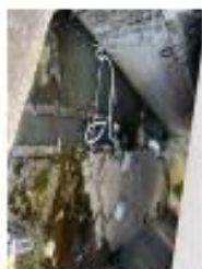
工業區服務中心 協助清除