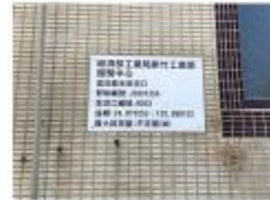
上游為工業區逕流廢水排放口