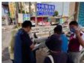
會勘報告追查情形