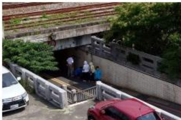
現場出席人員討論本案機車雨水道傾倒可能性