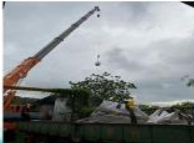
邊坡之泥土深層污染物清除，使用吸液棉及砂土吸附稀釋挖除，再使用吊車吊掛，共清運7袋太空包，移至資收場暫置。