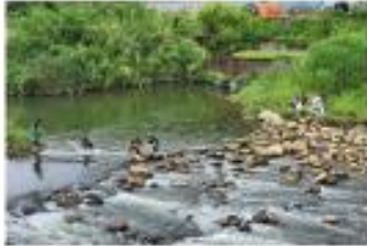
第一時間立即先以攔油索阻擋油污