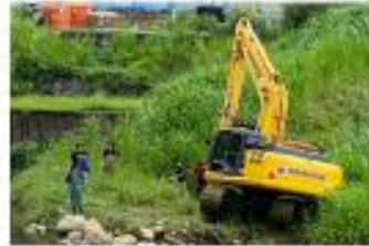
協調公所使用機具，清除污染區域雜草及邊坡土壤，以利後續作業