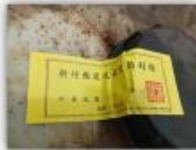
破損容器標記上封條