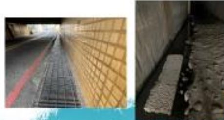
排放口上游及鄰近道 路均無污染跡象