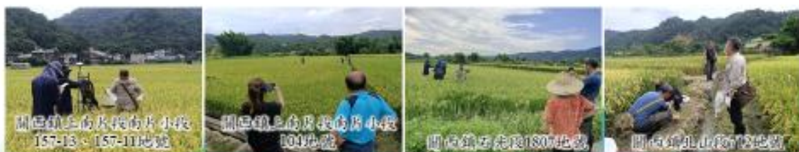
關西農地應變調查採樣情形