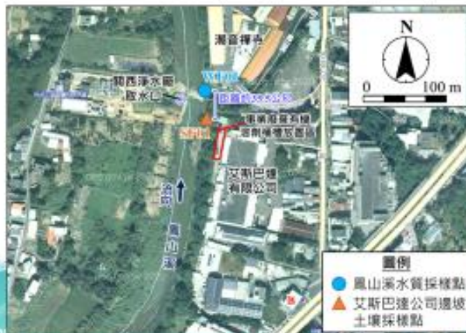
水質及土壤 採樣點位 示意圖