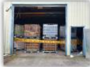
立即封鎖廠區防堵洩漏現場