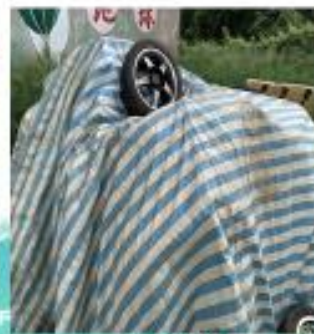
將污染區域之土壤清除(運)7袋太空包，暫移至資收場。