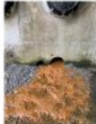
機車道雨水口 污染情形